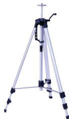
■ エレベーター三脚 LET-B