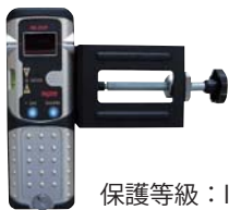
■ 受光器クランプセット RE-20IP / RC-2